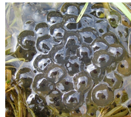
Ponte de grenouille rousse

Au printemps, la grenouille rousse pond des œufs regroupés en amas compacts qui flottent souvent à la surface de l'eau. Chaque ponte contient plusieurs milliers d'œufs et on peut compter des dizaines voire des centaines d'amas dans une même mare.