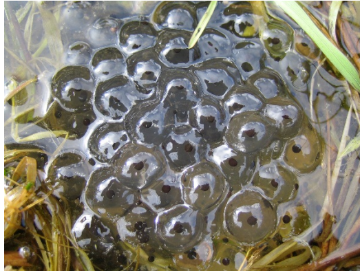
Ponte de grenouille rousse - © CREA