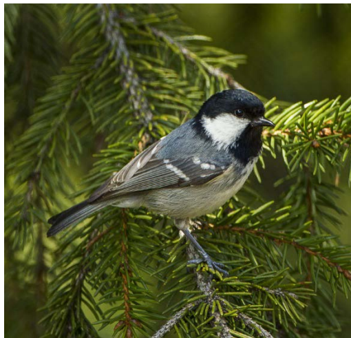
Mésange noire